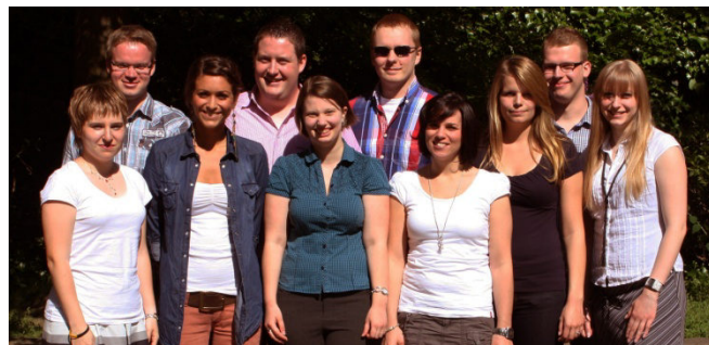
Die Projektgruppe „grüNE welle“ 2012

Städtische Schulen werden in differenzierten Workshops über verschiedene Möglichkeiten der Energieeinsparung informiert.